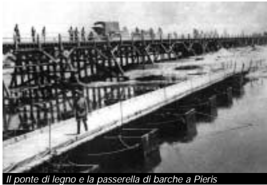
Il ponte di legno e la passerella di barche a Pieris

Un libro che contribuisce a far conoscere di più il nostro passato di combattenti, difensori e internati. Un contributo alla storia del Friuli orientale durante la Grande Guerra.