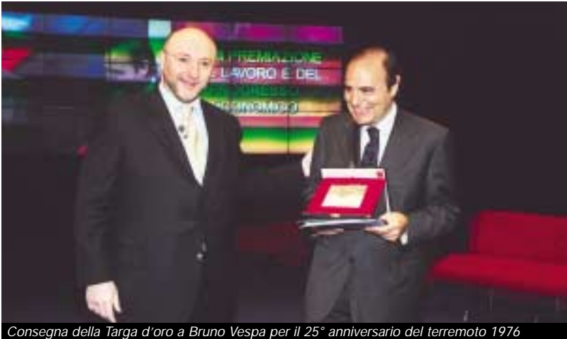
Consegna della Targa d'oro a Bruno Vespa per il 25° anniversario del terremoto 1976

Ho conosciuto i friulani prima del Friuli. La casa in cui sono nato, a L'Aquila, guarda il Gran Sasso. A chiudere il mio orizzonte domestico, ai piedi della montagna, quando gli alberi non erano cresciuti come oggi, vedevo la caserma degli alpini “Francesco Rossi”, la stessa da cui nei primi mesi del 2003 sono partiti gli alpini per la più rischiosa missione militare del dopoguerra in Afghanistan.