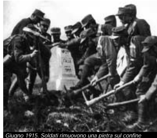
Giugno 1915. Soldati rimuovono una pietra sul confine