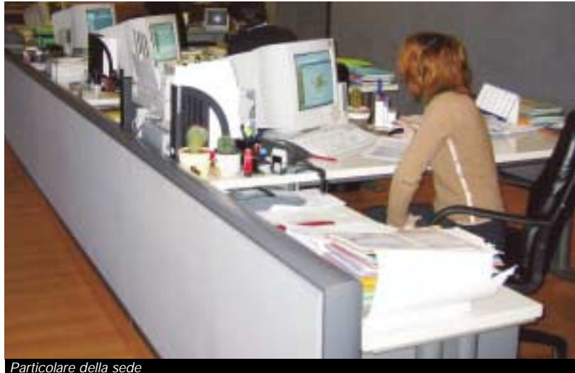
Particolare della sede

vo è anche quello riguardante le garanzie in essere che al 31 dicembre del 2002 hanno raggiunto i 140 milioni di euro, con un incremento del 17% rispetto al 2001. Il momento estremamente positivo del Congafi è confermato poi dall'aumento degli imprenditori artigiani che hanno deciso di associarsi. Lo scorso anno il saldo tra nuovi soci e cancellazioni è stato di 266 unità, con un incremento del 7%. Anche il 2003 pare confermare il trend positivo visto l'ingresso, nei primi tre mesi dell'anno, di 146