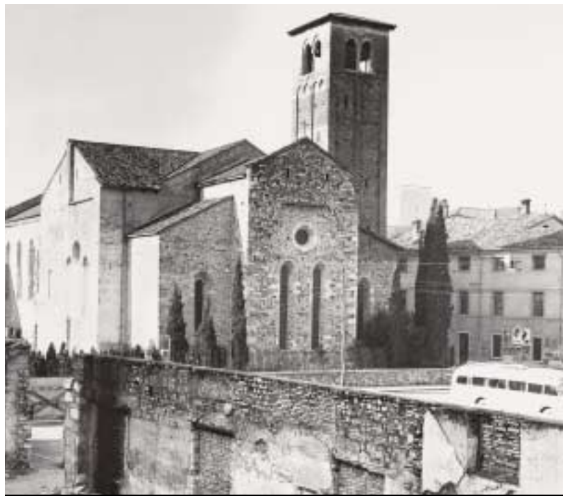
Piazza Venerio nel 1955 prima della costruzione dell'attuale Camera di commercio (T. da Udine)

dottor Vespa riconosce nei friulani l'essere schivi ma competitivi, modesti ma ambiziosi, un vero friulano acconsente e si compiace. In silenzio.