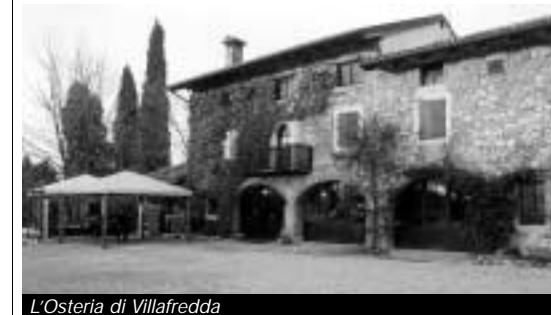
L'Osteria di Villafredda

C'è un borgo medievale a Villafredda (siamo nella frazione tarcentina di Loneriaco) che merita d'esser visitato. Poche case attorno alla bella villa Biasutti, ben inserite nella rigogliosa campagna friulana. Sono sufficienti pochi passi e subito si riscopre un pezzo della civiltà rurale appartenuta ai nostri avi. In questo prezioso castone architettonico ben s'inserisce anche l'Osteria di Villafredda, inaugurata nel 1991 e dal 1990 trasformata in ristorante. Si tratta del classico casolare costruito al centro d'un podere. Pur con le varianti imposte dalla nuova destinazione d'uso, il sito mantiene intatte le sue originali caratteristiche. Davanti all'ingresso c'è il cortile col ghiaino, le fioriere in pietra, le mole d'un