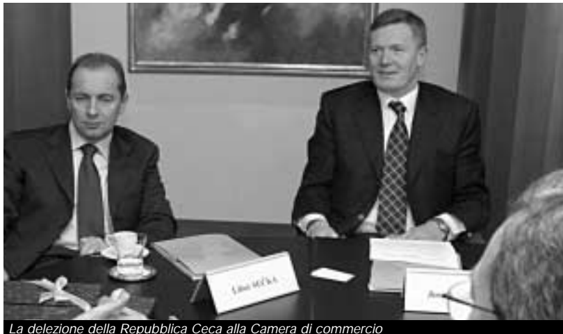
La delegazione della Repubblica Ceca alla Camera di commercio

«La Repubblica Ceca è uno dei Paesi con i quali i rapporti di collaborazione sono più stretti e proficui, tant'è che, per agevolare gli imprenditori friulani, abbiamo attivato uno sportello di consulenza apposito, al quale le aziende si posso-