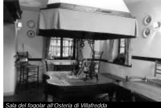
Sala del fogolar all'Osteria di Villafredda

gnon, fresco e leggermente profumato, come quello "biologico" dell'Azienda agricola Mont'Albano.