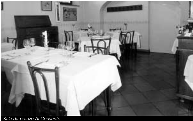
Sala da pranzo Al Convento

Provenendo dall'autostrada o da Cervignano, è nella via che s'imbocca subito dopo essere passati sotto l'omonima "porta". Numero di telefono e fax: 0432-923042. Sito web: www.ristorantealconvento.it . Giornata di chiusura per turno di riposo: domenica. Sono accettate tutte le carte di credito. Non esistono problemi di parcheggio.