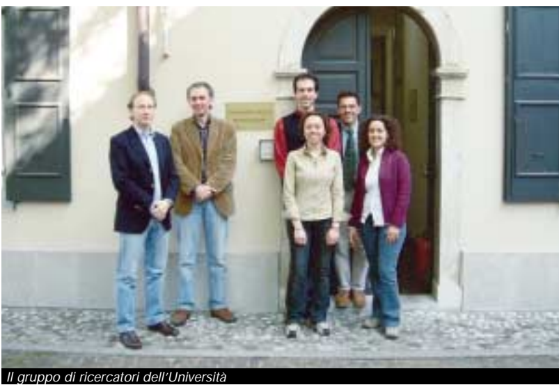
Il gruppo di ricercatori dell'Università

Laboratorio olfattometrico dinamico, Consorzio Friuli innovazione, via Marinoni, 14, Udine (telefono 0432 556850 fax 0432 227611), sito: www.uniud.it/cfi e-mail: cfi-lod@uniud.it .