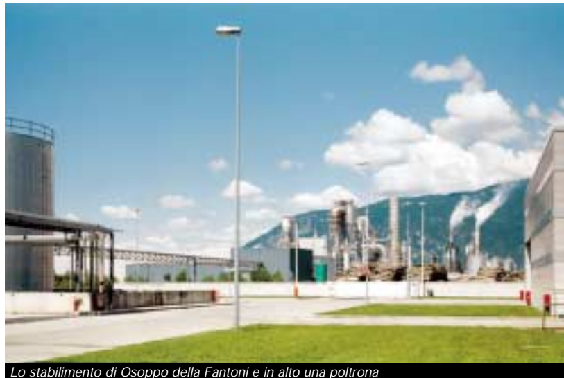
Lo stabilimento di Osoppo della Fantoni e in alto una poltrona

Progetto imprese-Università di Udine: settore industria