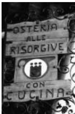
Osteria Alle Risorgive di De Tina Odilla & C. s.n.c. di Codroipo