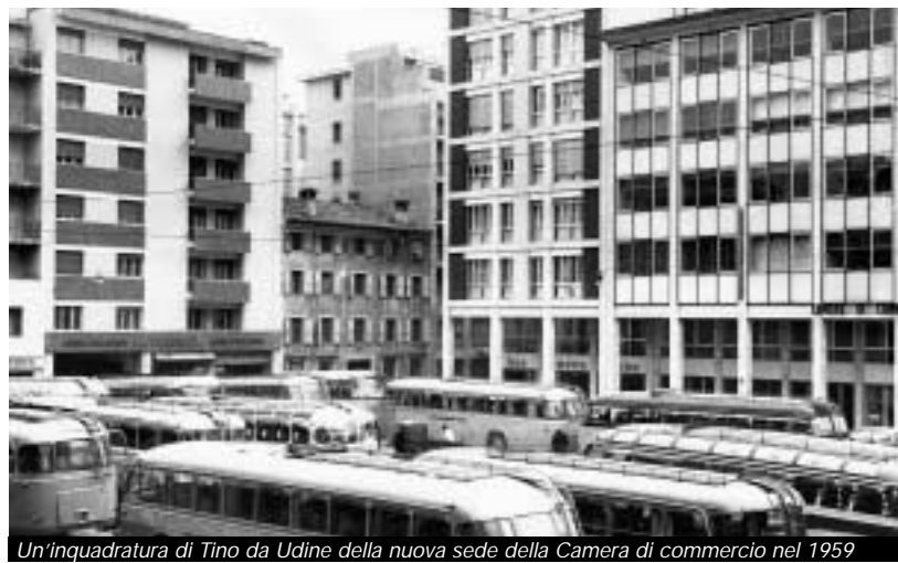
Un'inquadratura di Tino da Udine della nuova sede della Camera di commercio nel 1959