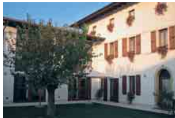
Esterno del locale

La ristolocanda Grani di Pepe è a Flaibano, in via Cavour, 44. Telefono e fax 0432-869356, cellulare 348-4787874; e-mail: info@granidipepe.com ; sito: www.granidipepe.com . Chiusura: domenica sera e lunedì. Ogni giorno, a pranzo solo su prenotazione.