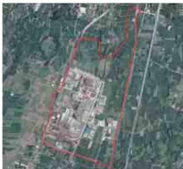
Il nuovo piano del Cipaf prevede l'incremento della superficie produttiva di 715mila metri quadri

del costo dell'energia elettrica. I proventi derivanti dall'attività del nuovo impianto, infatti, per oltre il 54%