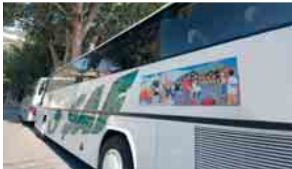
Da tempo la Saf ha stabilito uno stretto sodalizio con Modidi

470 autobus di proprietà, 630 dipendenti, 12 depositi e 17 parcheggi, 750 biglietterie e una rete capillare di servizi sul territorio, fanno di Saf una realtà all'avanguardia nel mondo del trasporto. Attenta al rispetto dell'ambiente e alle esigenze della clientela, Saf ha da tempo stabilito uno stretto sodalizio con Modidi, la poliedrica associazione recente vincitrice del pre-