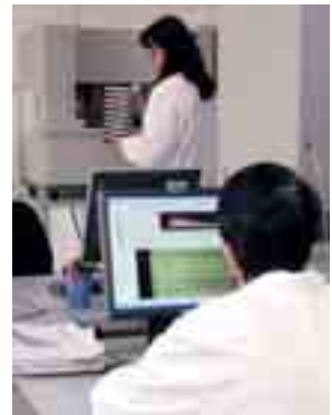
Il laboratorio dell'istituto di genomica applicata

delocalizzano e si internazionalizzano (anche in Cina), mentre Credra si appresta a sbarcare in Australia per proporre, in collaborazione con un'impresa belga, sistemi di controllo della produttività e dell'efficienza dei macchinari. Tutte e tre nel Parco hanno sviluppato sistemi innovativi che permettono loro di proporre sui mercati solu-