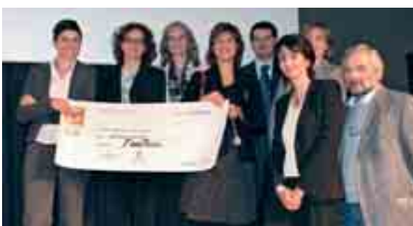
Il gruppo FoodTech, vincitore della finale locale udinese

L'appuntamento è fissato per il 4 dicembre alle 20.30 al teatro "Giovanni da Udine" e a presentare la serata ci sarà Fabio Fazio. Per la finale nazionale di Start Cup a confrontarsi saranno le 36 idee imprenditoriali che hanno vinto le rassegne locali curate dai 27 atenei in gara. I criteri di valutazione della giuria saranno sempre gli stessi: l'originalità dell'idea imprenditoriale, la realizzabilità tecnica, l'interesse del progetto per gli investitori, l'adeguatezza delle competenze del management team, l'attrattività del mercato di riferimento e, infine, la qualità e completezza dell'esposizione delle informazioni. Così come gli obiettivi che sono: sostenere la nascita di imprese ad alto contenuto di conoscenza e di innovazione (Spin off da ricerca); promuovere lo sviluppo economico del sistema, sia attraverso la creazione di nuove imprese e di nuovi settori produttivi a più alto valore aggiunto, sia attraverso il potenziamento dei processi innovativi nei settori più tradizionali; diffondere la cultura d'impresa nell'ambito della ricerca scientifica; potenziare il ruolo dell'università come "fabbrica di sviluppo territoriale e di trasferimento tecnologico"; potenziare le relazioni tra ricerca applicata e finanza innovativa.