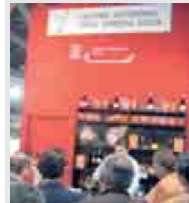
Lo stand della Cciaa affollato da "avventori" al Saie

Il comparto montano del legno era presente al Saie di Bologna dal 25 al 29 ottobre. Grazie alla Cciaa, l'offerta enogastronomica e turistica è stata affiancata alla presentazione della filiera del legno, in un'ottica di promozione di sistema. Una nutrita folla ha così potuto degustare i prodotti tipici dell'area montana: dagli insaccati affumicati ai formaggi, dal succo di mela alle Esse di Raveo accompagnati dai vini della Guida delle camere di commercio. Il corner di degustazione è stato allestito nell'ambito del Progetto Montagna camerale, mentre lo stand è stato coordinato dalla Legno Servizi di Tolmezzo e realizzato con la collaborazione di Mercati Aperti, Regione Fvg (Direzione Foreste e Direzione Comunicazione) e Assindustria.