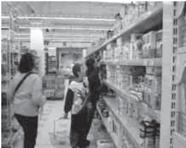
Confermata l'apertura a oltranza in dicembre dei negozi

re, e Confcommercio lo ha prontamente denunciato, non convince la soluzione adottata nell'Ato Nord udinese, quello collinare e pedemontano, dove è stata consentita una ventina di aperture domenicali all'anno. Diversa la situazione nel Medio e nel Basso Friuli, dove si è sicuramente raggiunto un miglior compromesso con un accordo su 16 domeniche. Confermata l'apertura a oltranza in dicembre, si è poi scelto di tenere i negozi aperti le prime due domeniche di gennaio e giugno e le seconde domeniche di febbraio, marzo, aprile, maggio, luglio, settembre, ottobre, novembre.