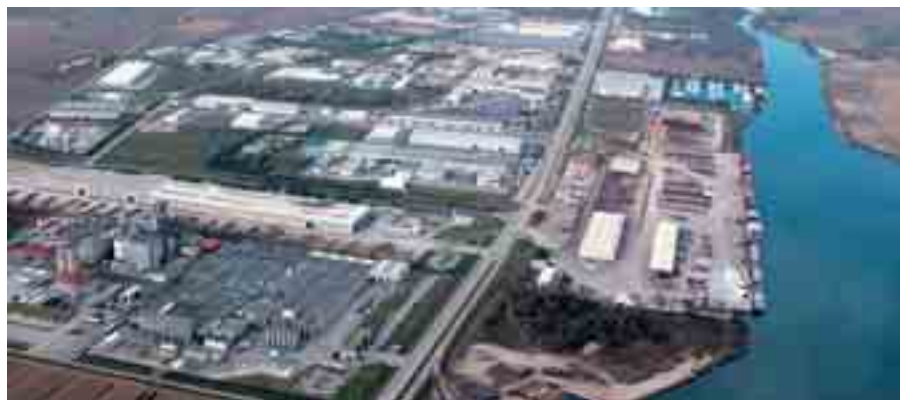
Porto Nogaro è divenuto negli anni uno snodo strategico per i traffici provenienti dal Mar Nero e diretti verso il Nord Africa e il Medio Oriente. Nel riquadro in alto il Porto di Trieste