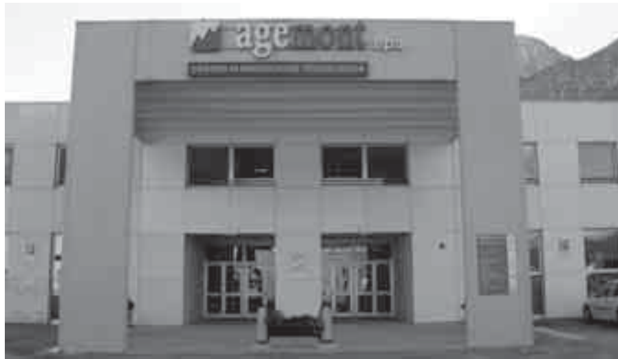
La sede dell'Agemont ad Amaro