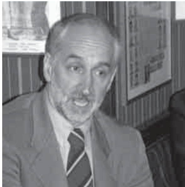
Milos Budin nell'attuale governo ha la delega al commercio con l'estero

Milos Budin è sottosegretario nel governo Prodi con delega al commercio con l'estero. E' uno dei bracci destri del ministro Emma Bonino in tale dicastero. E' stato parlamentare per i Ds e si è dimesso dalla Camera dei deputati lo scorso maggio per assumere l'incarico governativo. In passato è stato vice-presidente del Consiglio regionale e sindaco di Sgonico. Appartenente alla minoranza slovena, è impegnato a favore della tutela delle lingue e delle identità minoritarie. Docente, ha sempre militato a sinistra, prima nel Pci e poi nei Ds.