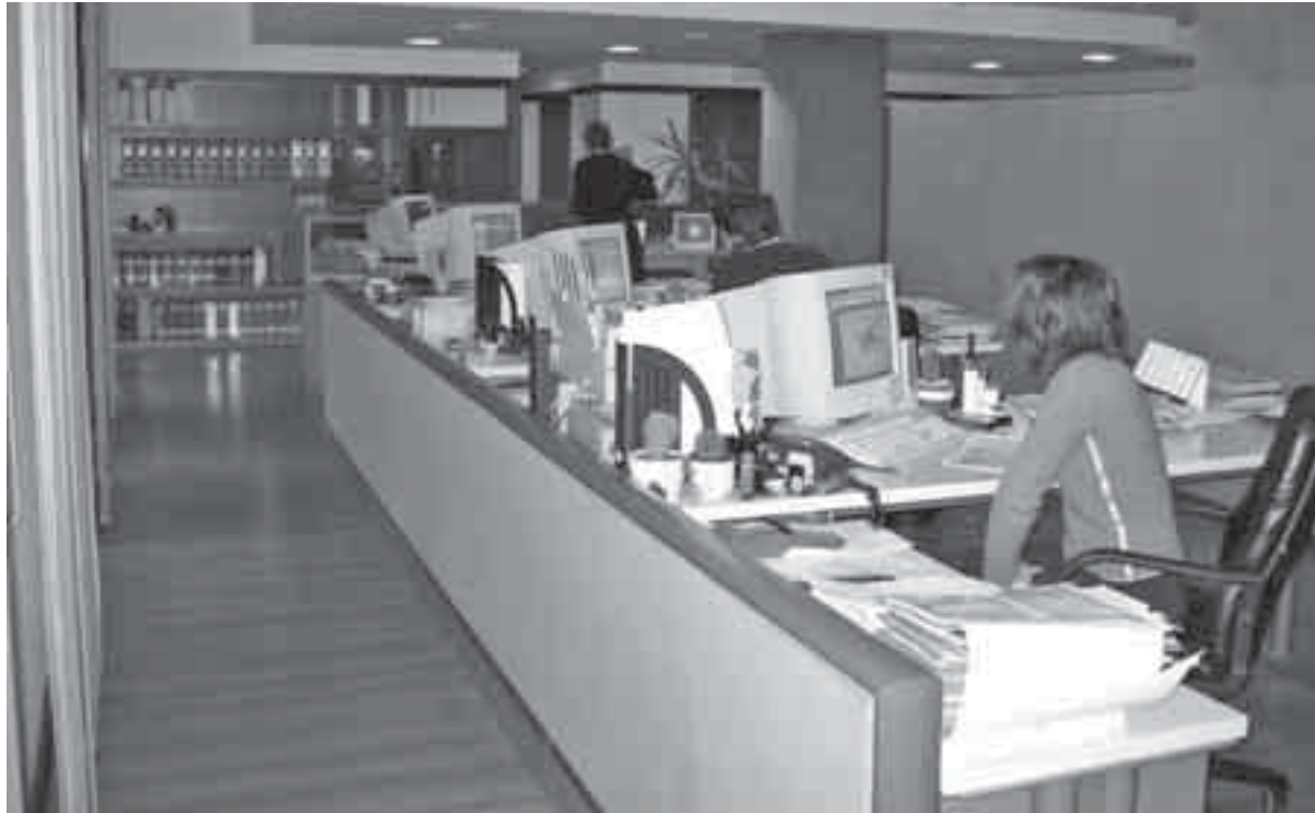
Gli interni della sede Confidi artigiano Udine in via Savorgnana 27

L'attinente normativa Comunitaria prevede che i Confidi inquadrati nell'art. 107 del T.U.B. (Testo Unico Bancario) siano considerati veri e propri intermediari finanziari, assoggettati alla vigilanza della Banca d'Italia. La garanzia sui finanziamenti erogata dai Confidi 107 è molto più "pesante" e consente alle banche di ridur-