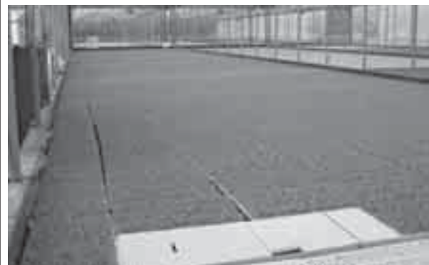
La tecnica del Floating System, ovvero della coltura fuori suolo

forza sui mercati mondiali di paesi come Usa, Turchia e Cile". Secondo Della Casa l'ortofrutta necessita quindi di un sistema organizzato, in grado di gestire la domanda e l'offerta di mercato e di orientare i disavanzi produttivi verso l'export, per evitare aumenti dei prezzi sul mercato domestico. Anche la logistica registra inefficienze: i vettori stradali difficilmente riescono a raggiungere una saturazione media superiore al 70% nei viaggi di andata, mentre i ritorni con carico sono inferiori al 30% dei casi. Per quanto attiene ai rapporti con la grande distribuzione, i produttori delegano al distributore l'esposizione