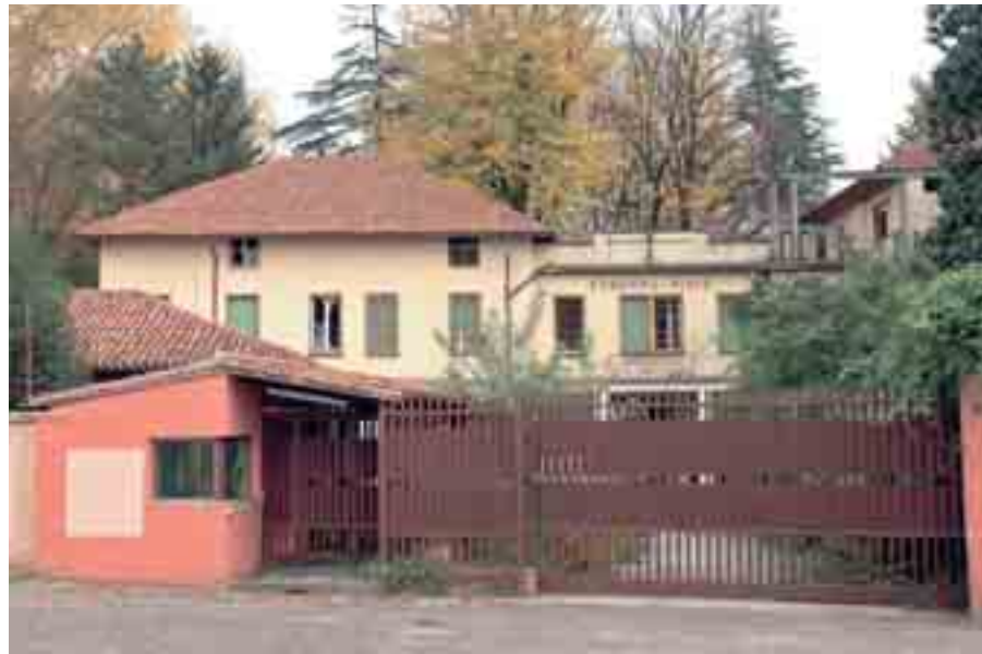
L'acquisizione della caserma Piave è il fattore chiave per poter avviare la Società di Trasformazione Urbana