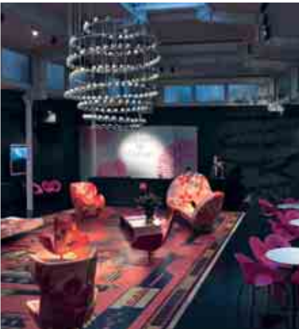
L'allestimento della Galleria Illy presente a Brera fino al 6 dicembre è opera della Visual Display