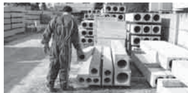
Sono venti i modelli messi sul mercato dall'impresa

Le canne fumarie "Tremetri" sono un brevetto