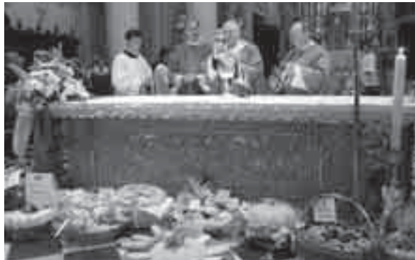
L'arcivescovo Pietro Brollo ha ricordato nella sua omelia il rischio che anche il lavoro dei campi nell'era della globalizzazione si trasformi in catena di montaggio

"Un momento di riflessione alla chiusura di una annata agricola non semplice, come capita ormai da diversi anni, ma che ha permesso di fare risaltare l'impegno, la tenacia, la fan-