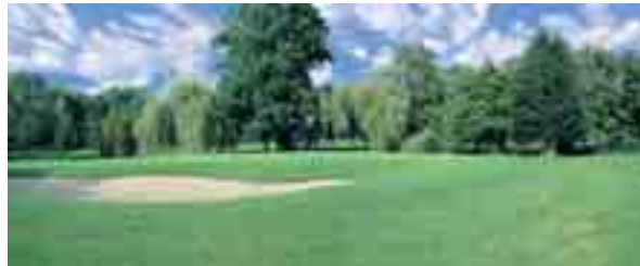
Il golf richiama ogni anno numerosi giocatori dalla Baviera, dall'Austria e dalla Slovenia