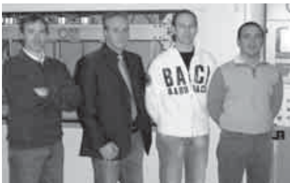
I soci della Torneria Friulana Piani di Dolegnano (San Giovanni al Natissone)

La Torneria Friulana Piani svolge la propria attività a Dolegnano di San Giovanni al Natissone, in via Dolegnano di Sotto, 31;