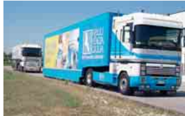
I camion Girba sono stati utilizzati da Regione e Autovie Venete rispettivamente per promuovere il turismo e la campagna di sensibilizzazione sulla sicurezza stradale

Gianpaoli, per i suoi service, si avvale di un network di professionisti e di aziende nazionali e internazionali che rappresentano il meglio del mercato per quanto riguarda tecnologia e affidabilità. "Solo così - afferma - si possono gestire eventi complessi e