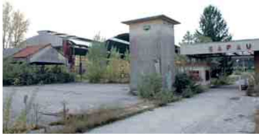
La zona dell'ex Safau a Udine sud diventerà un importante parco servizi

di privati le aree edificabili potranno essere tolte solo se ci sono motivazioni urbanistiche molto forti. E' chiaro, però, che di necessità le aree edificabili andranno ridotte, visto che erano state calcolate per una città da 300mila abitanti, mentre la nuova variante al piano sarà calibrata per 130mila», dice l'assessore alla Cavallo. Secondo il sindaco, «il problema non è quello di "diminuire" le aree edificabili, ma di rendere realizzabili le previsioni di insediabilità. Il piano regolatore non è un documento di fantascienza, ma un atto programmatico della gestione territoriale reale, quindi deve avere alla base delle ipotesi realistiche. Se conterremo le aree edificabili? Faremo un contingente coerente con l'evoluzione probabile della città».