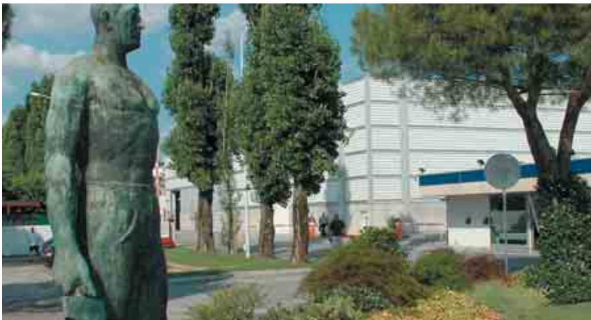
La Danieli SpA è pioniere nella progettazione e nella costruzione di impianti siderurgici

«Il progetto principale è quello di continuare con l'innovazione, con la scuola, con l'internazionalizzazione. Il gruppo ha assunto l'anno scorso, solo qui in zona, 250 persone, e per il futuro cercheremo di crescere ancora. Abbiamo fatto tutto quello di cui siamo stati capaci per essere più competitivi, però la nostra competitività sta soffrendo perché il sistema non è competitivo. Un esempio. Abbiamo una ditta, in Germania, di circa 150 persone. Per dare ad un giovane ingegnere italiano con famiglia lo stesso stipendio netto che diamo ad un ingegnere tedesco con le stesse caratteristiche, in Italia il costo per l'azienda è superiore del 25%. Questo per stipendi di 50.000 euro lordi all'anno; e questa forbice diminuisce o diventa addirittura vantaggiosa per l'Italia man mano che scende lo stipendio! Per non parlare poi del costo dell'energia e delle infrastrutture, che non sono business friendly. Tutto questo rimane un punto interrogativo, e se non si prenderanno decisioni che facciano riacquistare competitività al sistema, pochi possono predire il futuro da cinque anni in su».