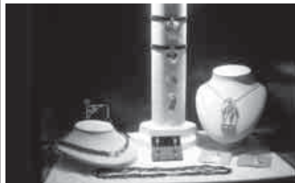
Anche quest'anno l'arte orafa era presente a Idea Natale

ma anche nuovi messaggi promozionali di impresa e territorio. Il progetto per la sua tipologia contiene molte delle istanze culturali del territorio del Fvg, mettendosi in sintonia con le sue realtà e chi le vive, dando ulteriore stimolo all'intelligenza delle mani e al piacere visivo ed emozionale della materia plasmata. Il tutto con l'intento di preservare un'economia locale, le nostre radi-