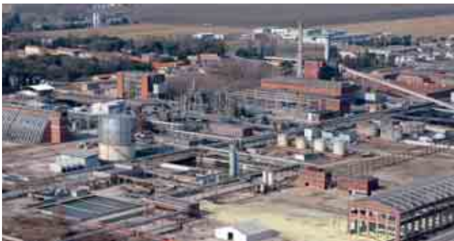
La zona industriale di Torviscosa

Infatti, l'inserimento in una rete di relazioni consente alla singola impresa di essere più propensa al-