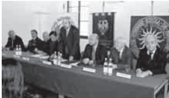
Tavolo delle autorità presenti al convegno di etica ed economia