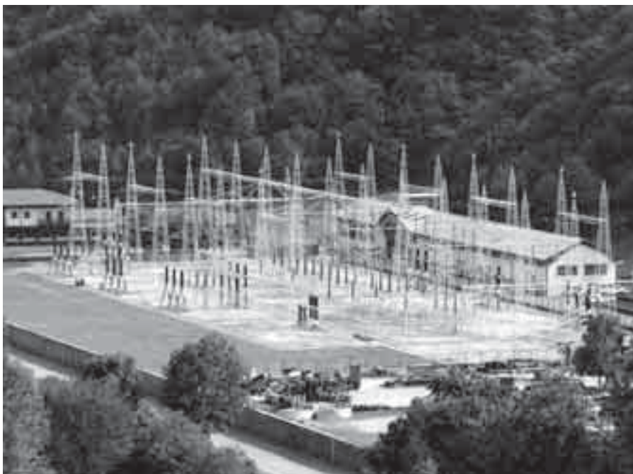
Due dei tre progetti prevedono come punto di partenza la centrale di Somplago