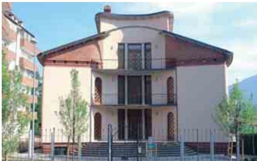
La sede del Cosint a Tolmezzo. Nel riquadro in alto, un'immagine della zona industriale di Osoppo