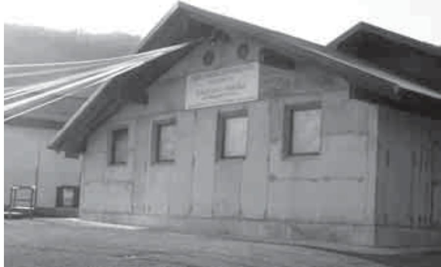
La struttura polivalente della Società Operaia di Priuso si trova in via Marconi 1/A a Priuso di Socchieve

La Società operaia sorse nel 1964 a Priuso di Socchieve ispirata da Giacomo Cortiula e Graziano Fachin che vollero dare un luogo di ritrovo per festeggiare gli emigranti che facevano ritorno in paese durante l'inverno, portando ricchezza di denaro e di idee. Così, dopo aver rimesso mano alle loro abitazioni sin dagli inizi degli anni 60, si sentì l'esigenza di una "casa comune", di un ritrovo per gli emigranti verso Francia e Svizzera, che erano ben l'80% della forza lavoro locale. I capifamiglia nel 1962 si tassarono quindi per comperare il terreno dove edificare la loro casa. Furono una sessantina i priussini che, dopo che la Società Operaia venne registrata il 2 gennaio 1964 e vide come primo presidente Giacomo Cortiula, successivamente sindaco di Socchieve, versarono circa una mensilità del loro stipendio annuale, mentre professionisti del posto redigevano i progetti, sempre gratuitamente. Anche il lavoro, quello fisico per gli sbancamenti e la costruzione del primo complesso, fu effettuato a titolo gratuito, con la sola restituzione delle spese vive per il gasolio. La Casa dell'emigrante entrò così nella vita quotidiana degli abitanti del paese; qui