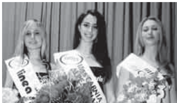
Nel dancing Priuso si tengono ogni anno le elezioni di Miss Carnia nell'ambito del circuito di Miss Alpe Adria International