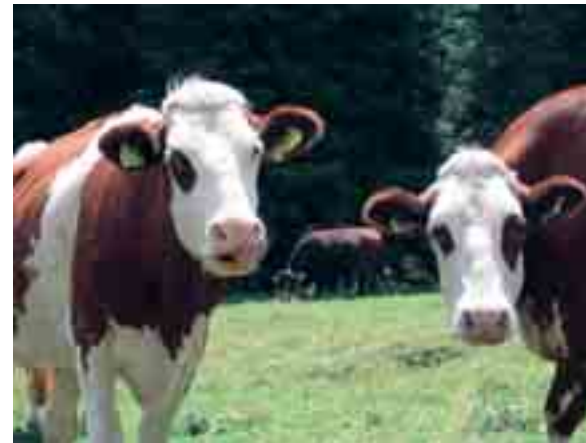
Sui prati di Carniagricola attualmente pascolano 130 capi. L'obiettivo è di raggiungere i 300 esemplari

Sui prati di Carniagricola, che d'estate utilizza gli alpeggi delle malghe Mediana e Cjansavet sopra Sauris, attualmente pascolano 130 capi, tra fattrici dedicate al latte e quelle indirizzate alla macellazione (razza Limousine da carne e Frisone da latte), con l'obiettivo di raggiungere i 300 esemplari. «L'azienda - aggiunge - non ha cambiato modo di lavorare: piuttosto nasce da un'ex stalla sociale, ristrutturata e in via di ampliamento e che ha un obiettivo chiaro, quello dell'automazione per ridurre l'impiego dell'operaio specializzato». L'agricoltura si appresta a cambiare volto, sembra sottolineare ancora l'assessore Marsilio: «Con le leggi sull'innovazione e sul riordino fondiario, abbiamo messo a disposizione del settore primario,