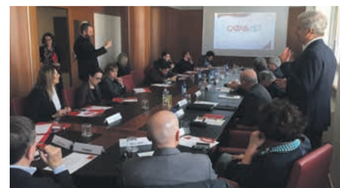
La presentazione degli eventi 2019. Sopra alcune immagini che ripercorrono il passato, il presente e il futuro dell'azienda