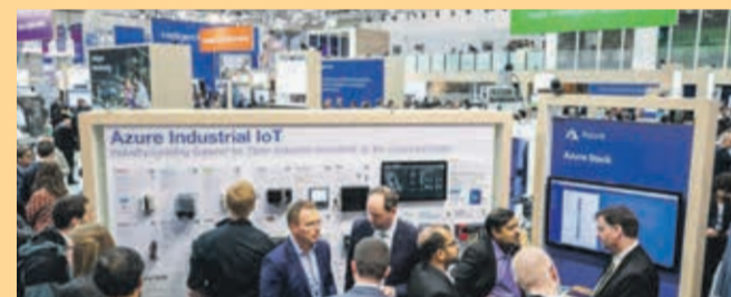
un'immagine della Industrial Supply di Hannover

Per le piccole e medie imprese del Friuli Venezia Giulia poter competere sui mercati esteri è elemento essenziale; di qui le ragioni della partecipazione - la ventottesima - della collettiva organizzata dal Centro Regionale della Subfornitura, dipartimento di ConCentro, l'Azienda speciale camerale, alla Industrial Supply di Hannover, manifestazione in programma a inizio aprile. Una kermesse di assoluto riferimento per il settore, con oltre 200 mila visitatori, 1.400 convegni e 5 milioni e mezzo di contatti business. «Le eccellenze produttive della nostra regione, e nel complesso quelle italiane - spiega il Vice Presidente della CCIAA, Giovanni Pavan - sono sempre più apprezzate dai produttori tedeschi di macchinari, mercato trainante dell'industria in Germania e del settore automotive. Il target delle aziende regionali su cui si focalizza il Centro Regionale della Subfornitura è costituito da micro-piccole imprese che non dispongono al proprio interno di una struttura commerciale internazionalizzata o da altre che difficilmente, al primo anno di